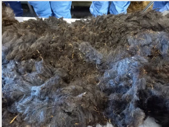
Efter utfodringsperioden inomhus är det vanligt med hö skräp i ullen i nacken och på ryggen. Sådant sorteras skilt som II-klass ull

I sorteringen tas också bort områden med märkfärg. Färgen lönar det sig att sätta på djurets panna, inte på ullen.