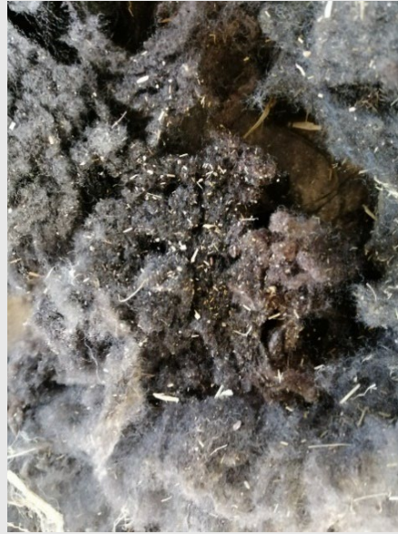
Ifall det finns diarré i ullen lönar det sig att städa bort den på förhand. De klottar ner ullen på andra djur också.

I sorteringen tas också bort områden med märkfärg. Färgen lönar det sig att sätta på djurets panna, inte på ullen.