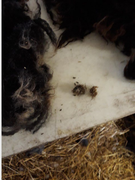
Kardborre, tovad ull, hö skräp. Sådant sorteras bort.

Under sorteringen tas från fällen bort tovad och smutsig ull (urin, avföring, spott). Bortsorterad ull kan vara mellan 20-25% av ullen från ett djur. För kort ullfiber (under 4 cm) och ullklipp duger inte heller för vidareförädling.